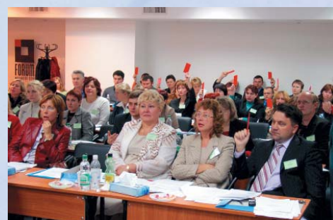
Основатели УАСБА голосуют положения устава организации

Важную роль в деятельности организации будет играть продвижение в Украине Международных стандартов финансовой отчетности (МСФО). Этот процесс сегодня охватывает девяносто две страны мира, включая Европейский Союз. Выбирая курс на внедрение МСФО, профессиональные бухгалтеры Украины тем самым выражают свою поддержку магистральному направлению развития, избранному украинским обществом, а именно направлению международной интеграции.